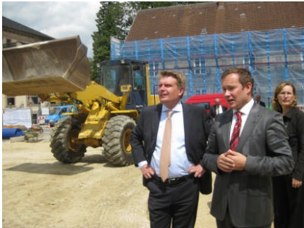
MdB Bareiß bei der Besichtigung der Baustelle „Deutsches Haus“