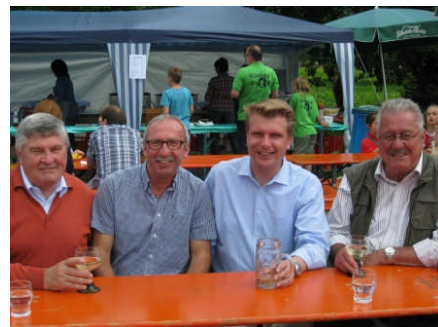
Bei den Regionskinderchortagen in Bolstern erhielt Thomas Bareiß MdB Einblick in die dortige Jugendarbeit