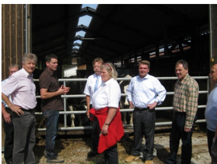
Besuch des Milchviehbetriebes Uhrenbacher in Inzigkofen