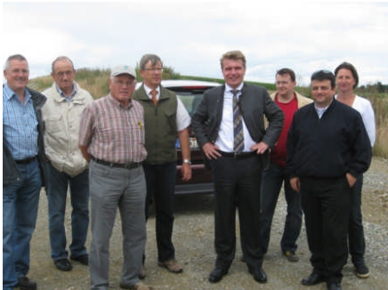
Mit den Mitgliedern der Bürgerinitiative besichtigte Thomas Bareiß MdB die Baustelle der Ortsumfahrung Herbertingen