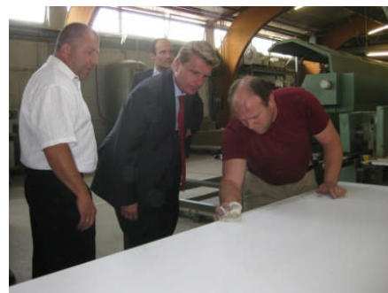
In Ostrach sammelte er Eindrücke von mittelständischen Unternehmen. Hier bei der Firma MöPro GmbH