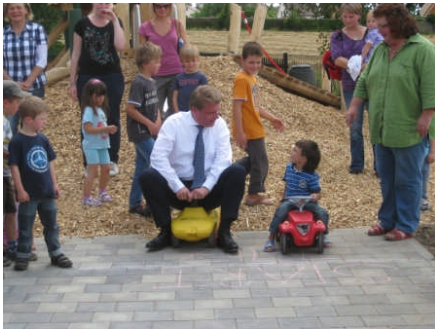
Einweihung der Außenanlagen und der Spielgeräte der Kinderkrippe in Sauldorf