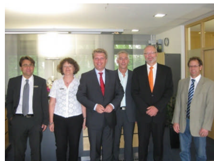
...und die Neufraer Bank