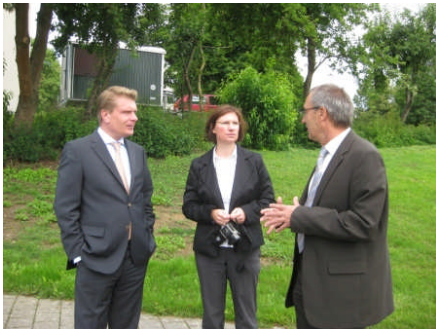
Besuch der Zollschule in Sigmaringen