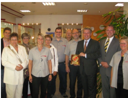
Besichtigung der Firma Uhren-Pfeiffer in Stetten a.k.M.