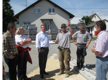
Bei der Firma „Martin Frey Hof und Garten“ und beim Autohaus Bippus-Jäger in Engelswies