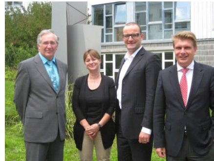
Zusammen mit Jens Spahn MdB bei der Seniorenwohn- anlage Fideliswiesen