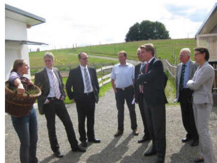
Besuch der neuen Fachklinik Zieglerische Anstalten