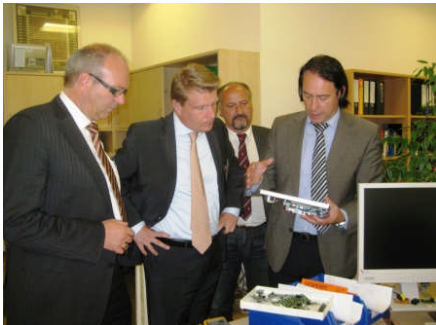
Betriebsbesichtigung bei der Firma Schaefer in Laiz