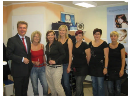
...den Friseursalon „Vera“...