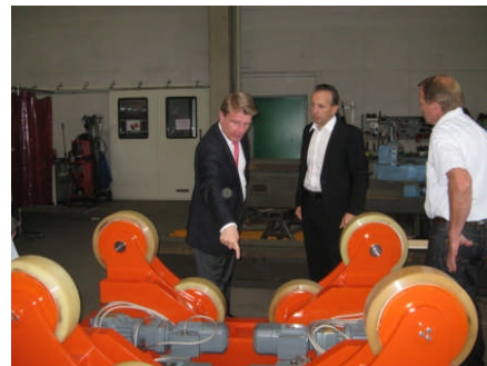
Thomas Bareiß MdB besichtigt die Firma Kistler Maschi- nen- und Anlagenbau GmbH