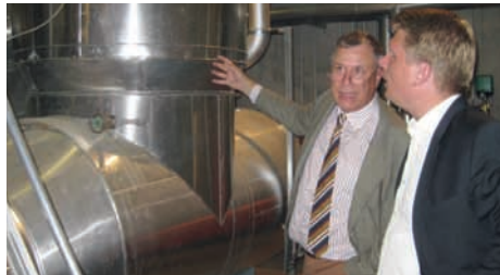
Firma Steidle in Krauchenwies