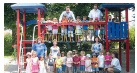
Kindergarten Regenbogen in Rosenfeld