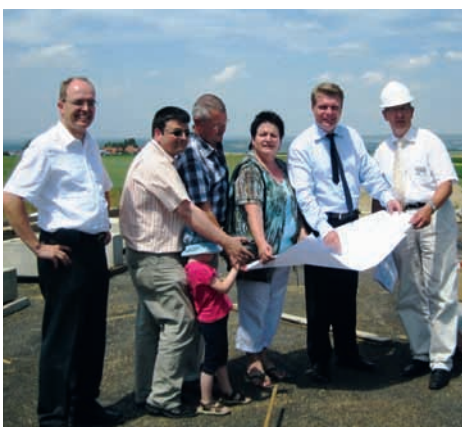
Baustelle Ortsumgehung Herbertingen 14.7.2010

Kaum ein anderer Faktor ist für Mensch und Wirtschaft von so existenzieller Bedeutung wie die Infrastruktur. Nur durch sie kann garantiert werden, dass unsere Volkswirtschaft funktioniert und weiter Bestand hat. Wir sind auf gut ausgebaute Straßen und Schienennetze angewiesen, damit unser Wirtschaftsstandort auch weiterhin gestärkt wird. Doch leider muss ich feststellen, dass gerade in diesem Bereich die Investitionen eher rückläufig sind.