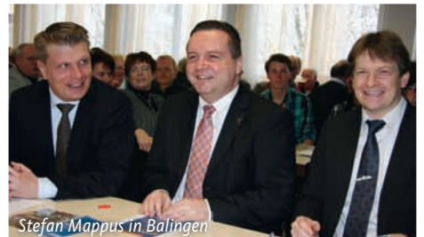
Stefan Mappus in Balingen