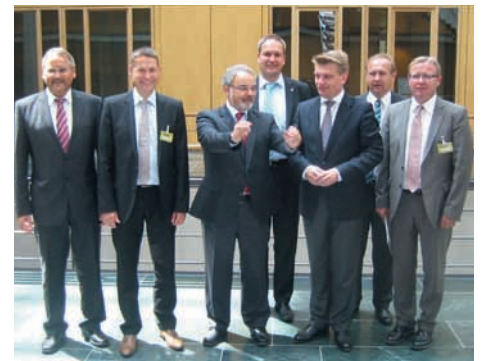
Nach dem Treffen mit Staatssekretär Kossendey