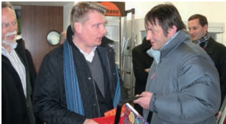
Tafelladen in Albstadt