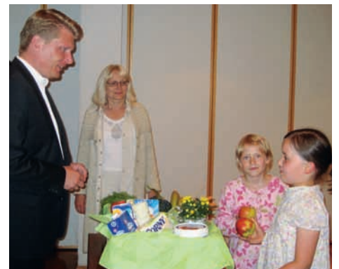
Göge-Schule in Hohentengen

Für dieses Modell setzt sich auch Bizerba seit einiger Zeit ein. Daraus ergäbe sich dann eine deutliche Entlastung der staatlichen Behörden. Die Behörden könnten sich dann vermehrt auf die Marktüberwachung konzentrieren, was folglich zu einer Verbesserung des Verbraucherschutzes führen würde. „Der Verbraucherschutz ist ein sehr wichtiges Thema. Um eine Verbesserung in diesem Bereich zu erwirken müssen Unternehmen und Politik gemeinsam an einem Strang ziehen“, so Bareiß.