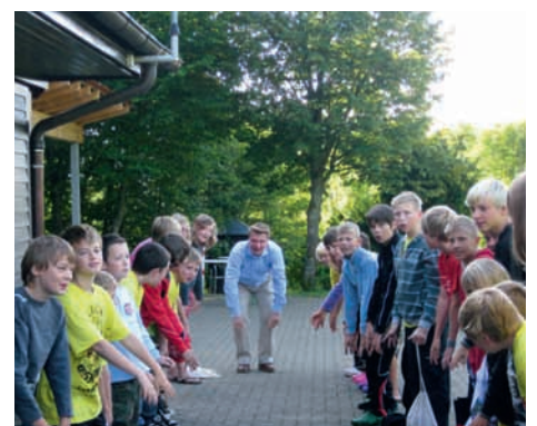
Jugendzeltlager in Margrethausen