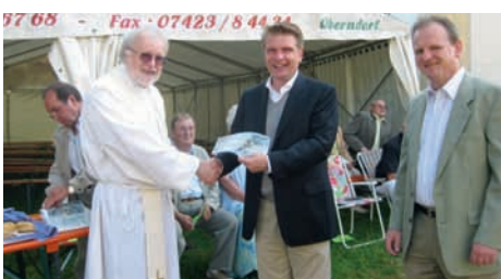
Sankt-Anna Fest in Haigerloch