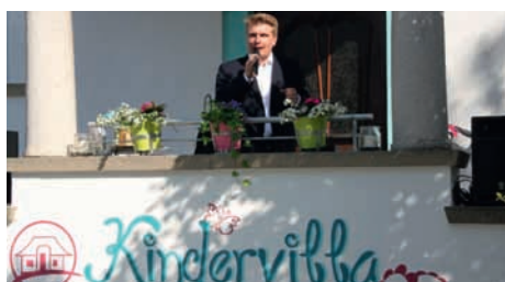
Eröffnung Kindervilla in Balingen