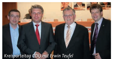
Kreisparteitag CDU mit Erwin Teufel