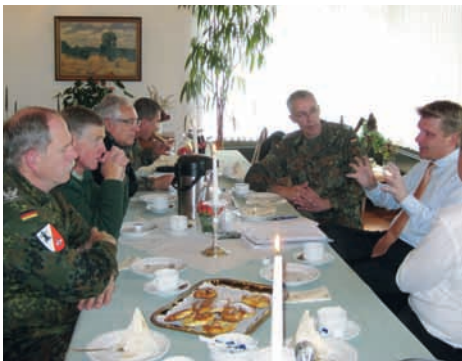
Gespräch mit der Bundeswehr in Stetten a.k.M.

Es lässt sich leider nicht bestreiten, dass in Deutschland einige Standorte wegfallen werden, denn Standorte können nicht aufgrund eines Selbstzwecks erhalten werden. Wir brauchen vor Ort leistungsfähige Einheiten, die auch zukünftige Strukturentscheidungen überdauern können. Die Entscheidung, welche von der Strukturreform betroffen sein werden, wird aber erst im Herbst diesen Jahres fallen. Bis dahin werde ich mit ganzer Kraft weiterkämpfen.